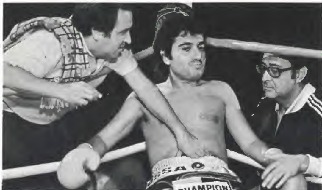
Fernando Esteso - Andrés Pajares - Antonio Ozores

PRODUCTORA: Izaro Films, S.A.- Raimundo Fdez. Villaverde, 65. Madrid-3. GUIONISTA: Mariano Ozores. DIRECTOR: Mariano Ozores. FOTOGRAFIA: Raul Artigot. MÚSICA: Alfonso Agulló. MONTAJE: Antonio Ramírez. INTERPRETES: Fernando Esteso, Andrés Pajares, Antonio Ozores, Florinda Chico, Rafael Hernández, Mirta Miller, Narciso Ibáñez Menta. Eastmancolor-Panorámica-Duración: 1 h. 38 m. Distribuidora nacional y Venta mundial: Izaro Films, S.A.- Raimundo Fernández Villaverde, 65 - planta 25 (Edificio Windsor). Madrid-3.